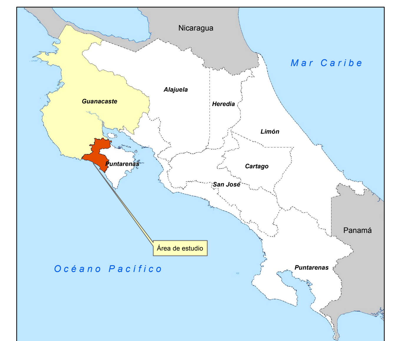
MATRIZ DE INFORMACIÓN DE VALORES DE TERRENOS POR ZONAS HOMOGÉNEAS PROVINCIA 5 GUANACASTE CANTÓN 09 NANDAYURE DISTRITO 02 SANTA RITA